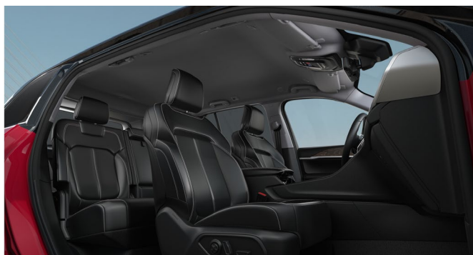
Istuimien musta nahka-/vinyyliverhoilu 'Capri'