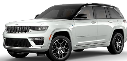
Bright White (valkoinen)