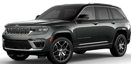
Baltic Grey (harmaa)