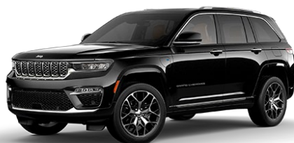
Diamond Black (musta)