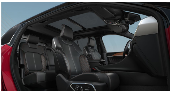
Istuimien musta nahkaverhoilu 'Palermo'