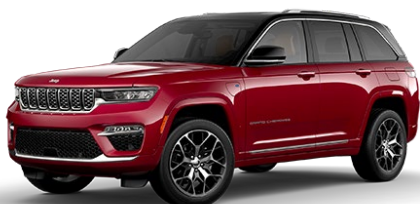
Velvet Red (punainen)